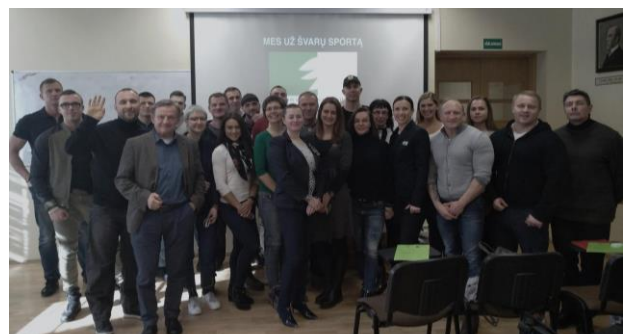
Kovo 24 d. vyko seminaras apie varžybų taisyklių pakeitimus bei dopingo patikros procedūrą ir jo žalą.